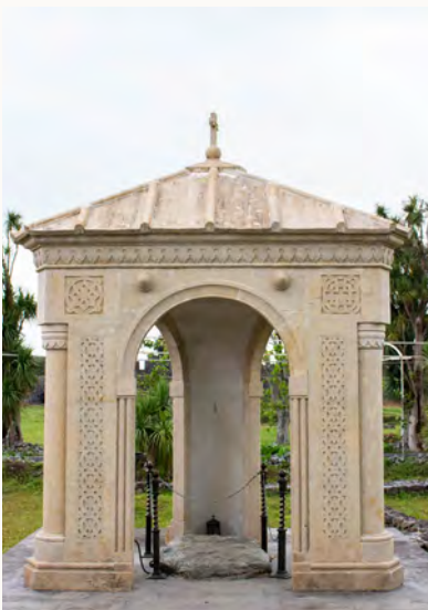
Site funéraire de l'apôtre Matthias à Batumi en Géorgie

Suite à la mort de Judas, les onze apôtres durent tirer au sort pour le remplacer : « Toi, Seigneur, qui connais tous les cœurs, désigne lequel des deux tu as choisi pour qu'il prenne, dans le ministère apostolique, la place que Judas a désertée en allant à la place qui est désormais la sienne. » On tira au sort entre eux, et le sort tomba sur Matthias, qui fut donc associé par suffrage aux onze Apôtres. » (Actes des Apôtres, chap. 1, 24-26).