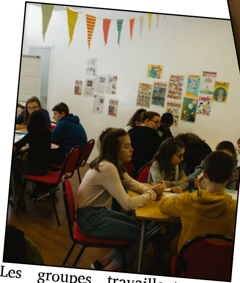
Les groupes travaillent pour faire ressortir différents thèmes