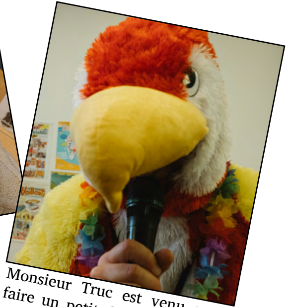
Monsieur Truc est venu nous faire un petit discours