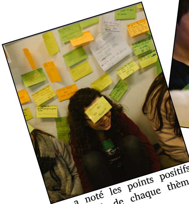
On a noté les points positifs et négatifs de chaque thème sur des post-it.