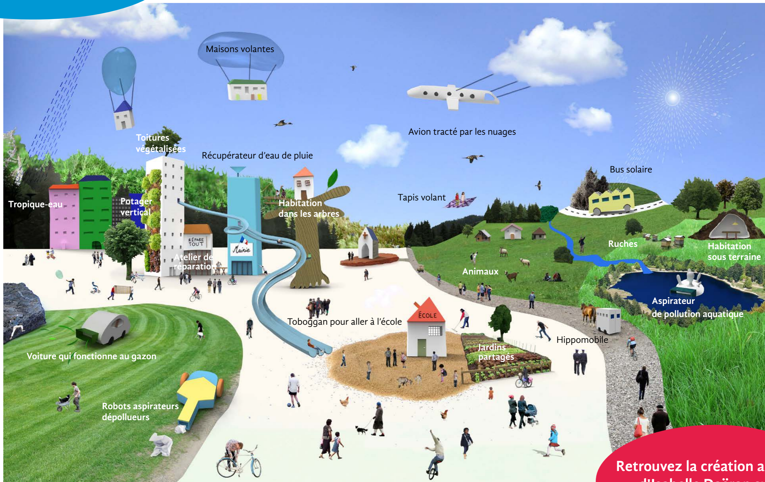
Photomontage : Isabelle Daéron d'après les idées des enfants.

Les enfants peuvent être source d'inspiration et d'innovation. Il n'y a qu'un pas entre leurs rêves et la réalité. Leurs visions peuvent ouvrir le champ des possibles et inventer un style de vie répondant aux problématiques actuelles.